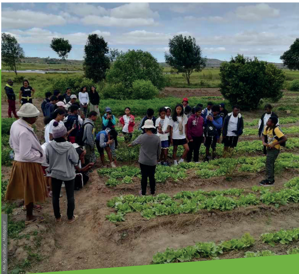
Min. Agriculture, Madagascar

Le Ministère de l'Agriculture de Madagascar accompagne l'intégration de l'agroécologie dans les formations agricoles à travers l'actualisation de ses référentiels de formation. Il s'appuie pour cela sur les acteurs de développement locaux pour faire évoluer les pratiques de formation et de conseil.